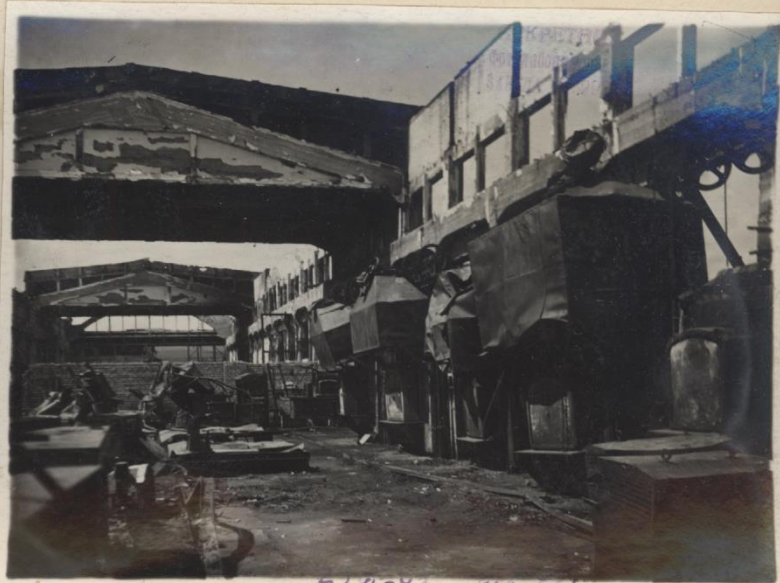
29vi-43. №1. 221