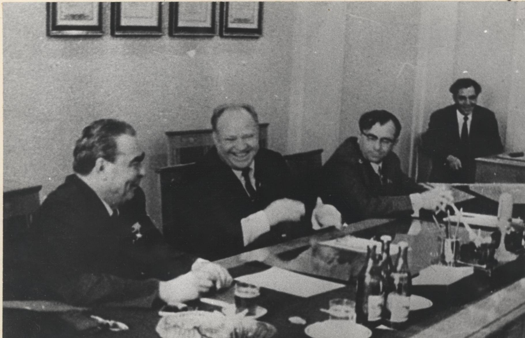
Первый секретарь ЦК КПСС Леонид Ильич Брежнев во время официального визита в Саратов на совещании в Саратовском обкоме КПСС (в центре – первый секретарь обкома Алексей Иванович Шibaев)