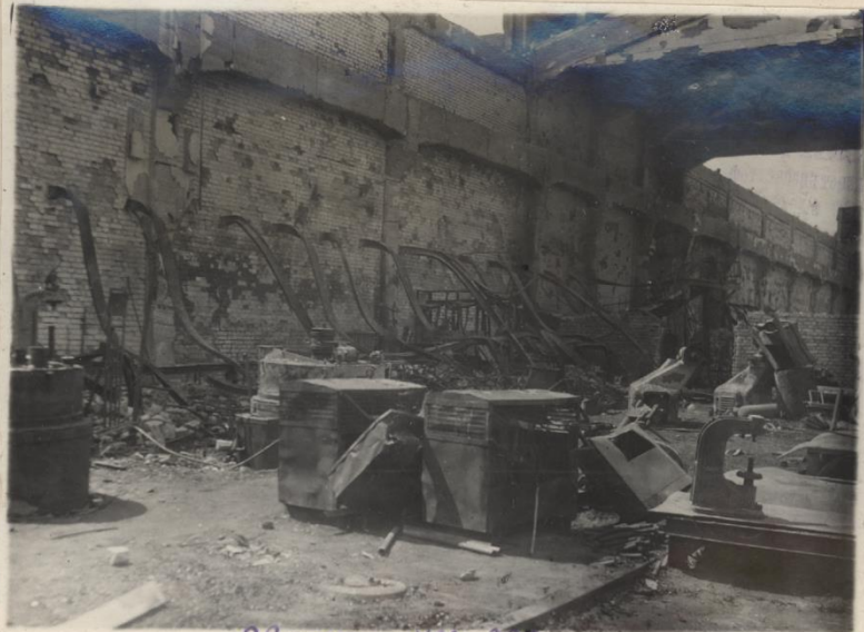
29vi-43. №1. 222