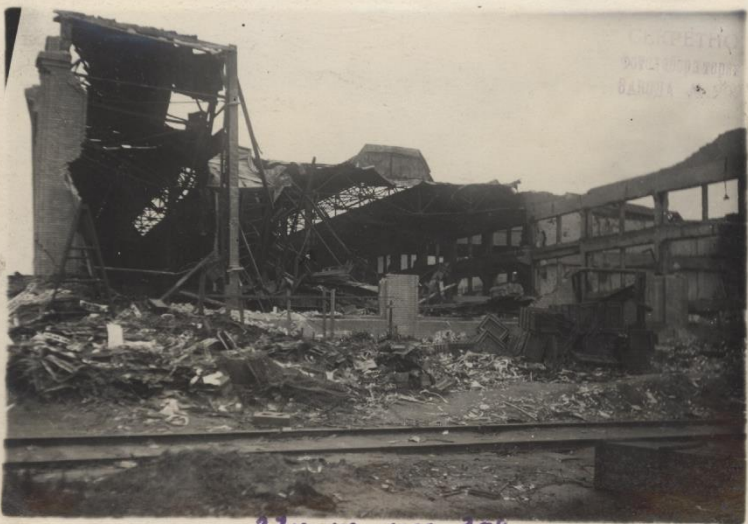
27vi-43 №1 208.