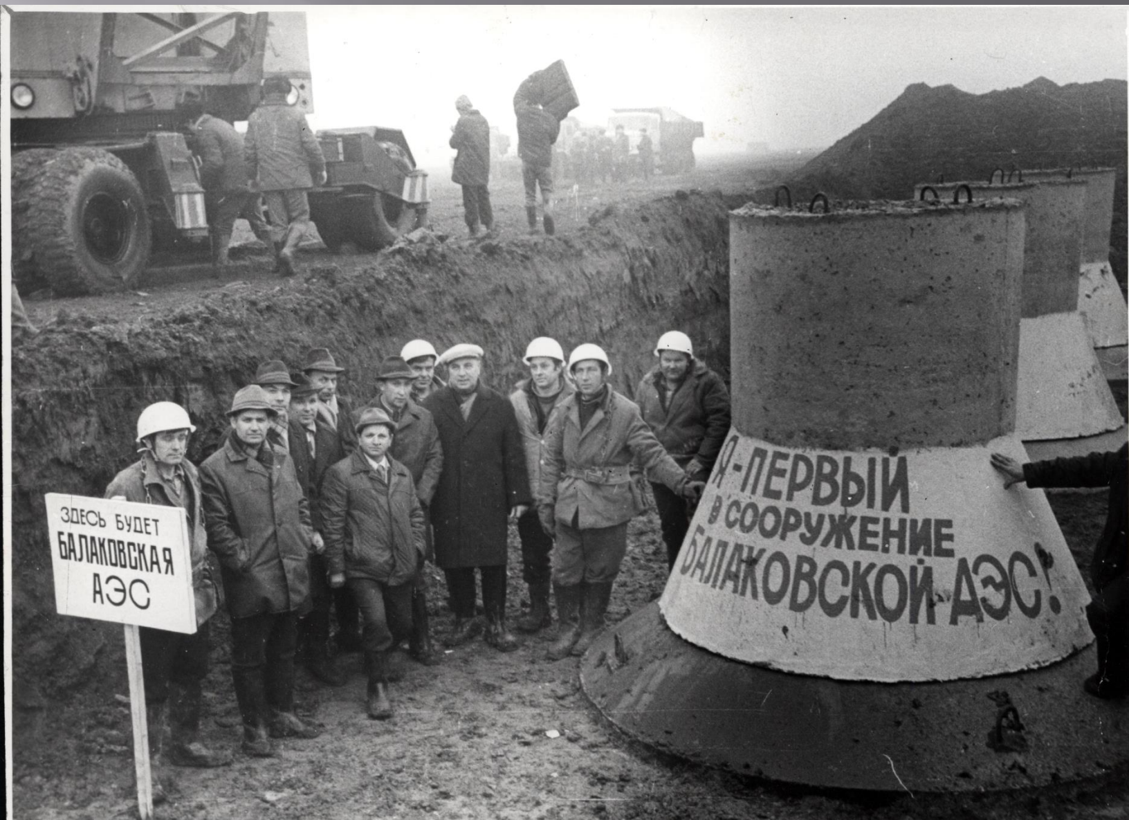
Закладка первого блока при строительстве Балаковской атомной электростанции. Фотография. Октябрь 1977 г. ГАНИСО. Фотоколлекция. Оп. 1. Д. 653. Л. 1.