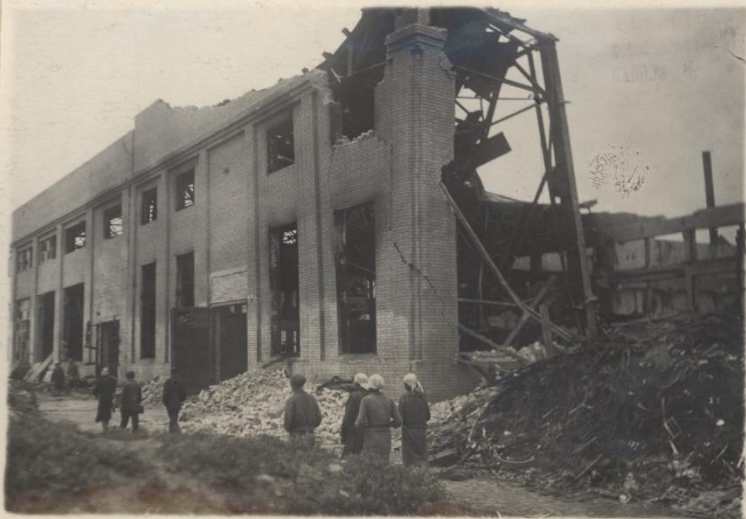
27vi-43. №1. 208.