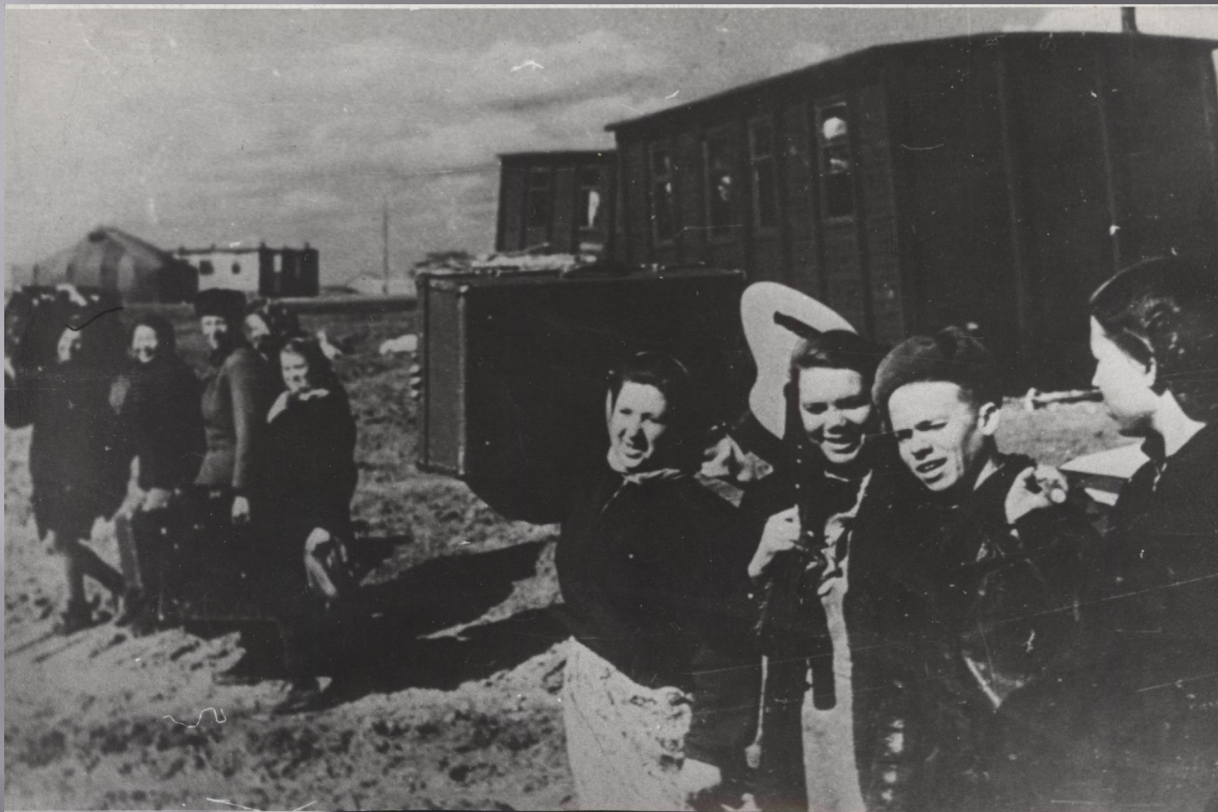
Новосёлы-комсомольцы в целинном совхозе «Озинский» Саратовской области. Фотография. Март 1954 г.